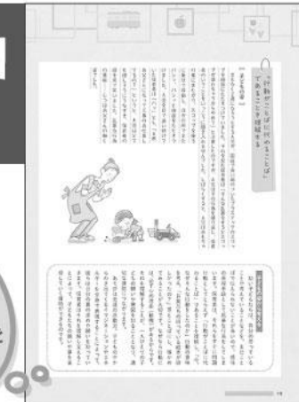
事例とイラストでわかりやすく解説します

ことばの育ちは保育所保育指針における保育目標のひとつであり、幼児期の終わりまでに育てほしい10の姿のひとつでもあります。乳幼児期にことばへの興味・関心を育て、豊かなことばによって他者とのかかわりを築く保育の展開はとても重要です。本特集では、子どものことばを豊かにするための環境や、保育者のかかわりの大切さをあらためて考えるとともに、保育現場での子どものことばの発達につながる取り組みを紹介します。