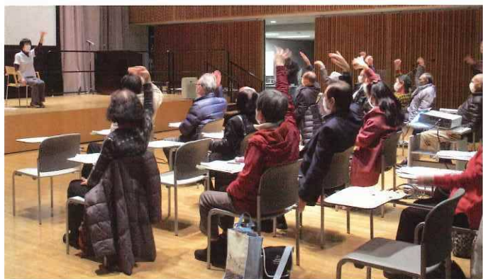
シニアタレント・語り部養成研修会

シニア世代の方々には、永年にわたって培った豊富な知識や技能などを、お持ちの方が多くいらっしゃいます。そのあなたの能力・才能(タレント)を地域社会や子どもたちのために、ぜひ役立てませんか。富山県いきいき長寿センターでは、あなたの意欲・やる気を応援します!!