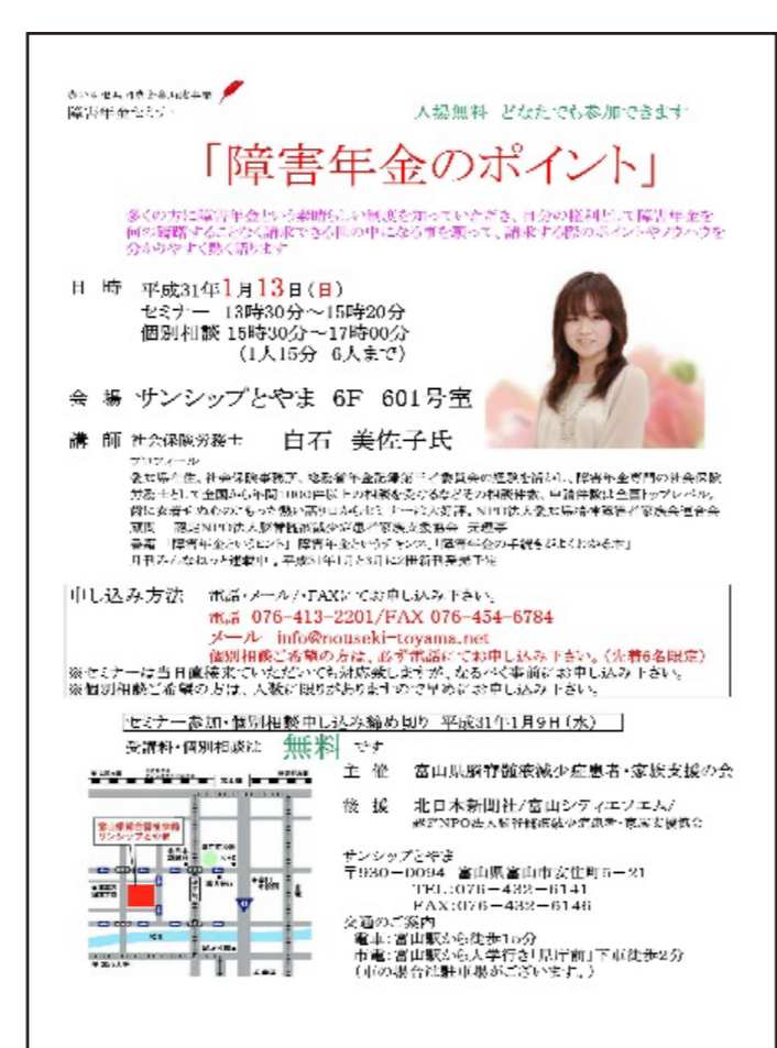
障害年金セミナー ちらし