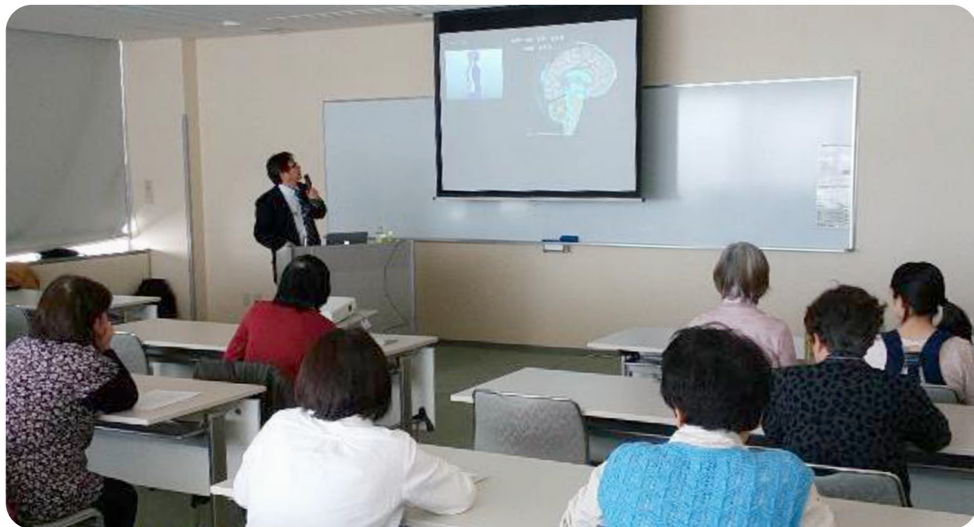
脳脊髄液減少症 勉強会

「脳脊髄液減少症を理解しよう」「障害年金セミナー」等々のイベントなども開催しました。