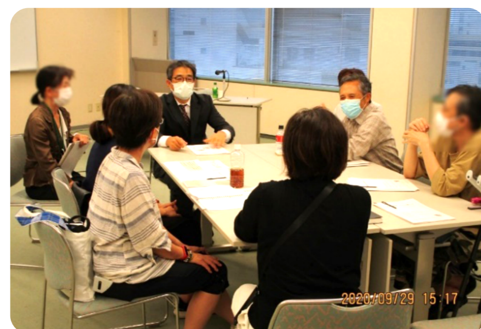
【富山県支部】 富山県難病相談・支援センターの 患者交流会に参加