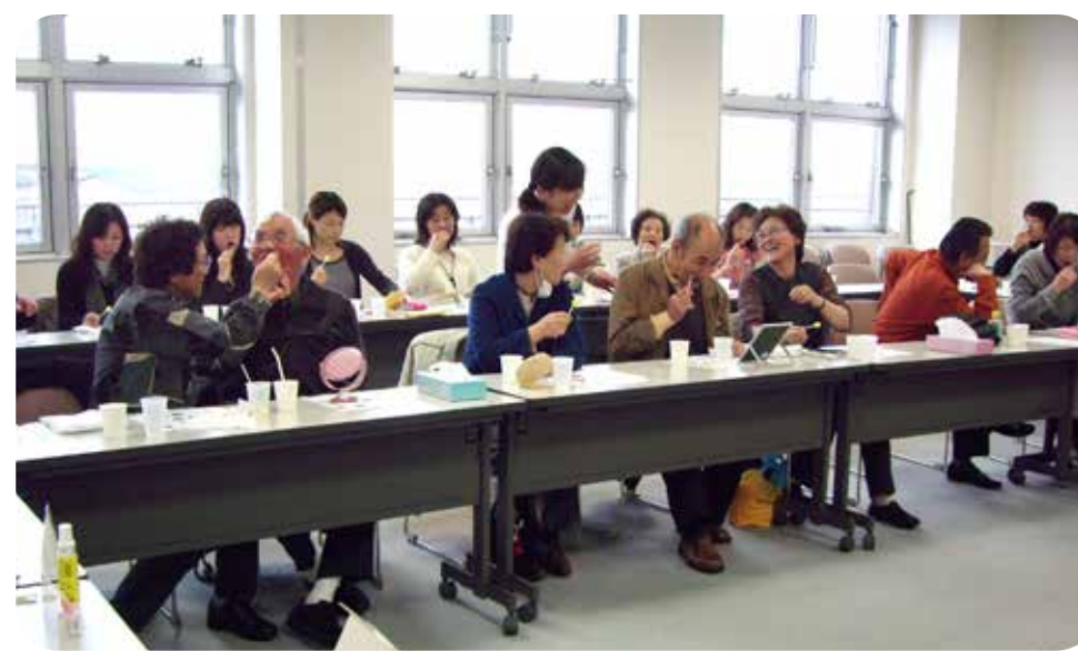
地区交流会の様子