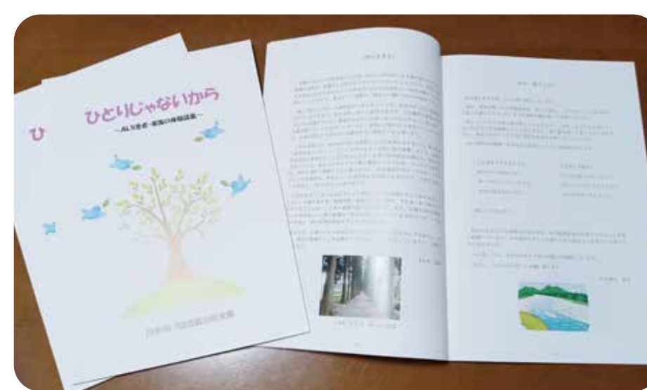
体験談集「ひとりじゃないから」