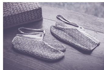
竹行李 陸中鳥越(岩手) 1930年代 刺子足袋 羽前庄内(山形) 1940年頃 いずれも日本民藝館蔵

約100年前に思想家・柳宗悦は、市井の人々の暮らしで用いられてきた手仕事の品に美を見出し、民衆的工藝=民藝と呼びました。本展では、そうした民藝の品々約150点を展示します。柳が説いた生活の中の美、民藝とは何か、そのひろがりと今、そしてこれからの姿を展望する展覧会です。この講座は会場で、担当学芸員からの解説を受けながらの鑑賞を予定しています。