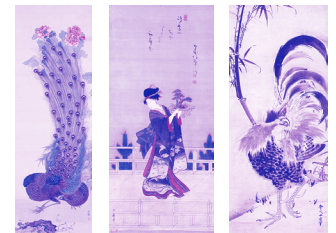
岡本秋暉 芙蓉孔雀図 喜多川歌麿 橋台持ち娘立姿図 曾我蕭白 竹に鶏図 いずれも滴水軒記念文化振興財団蔵