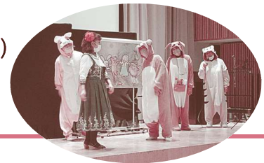
昨年度の事例発表