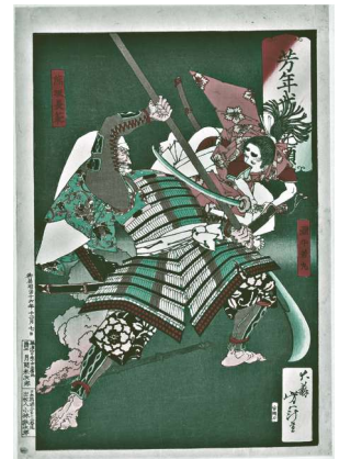
芳年武者无類 源牛若丸 熊坂長範 (1883年)