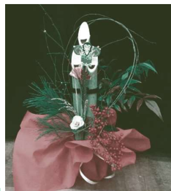
作品例 高さ 30~40cm